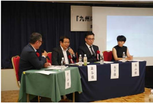
写真-3 キックオフフォーラムでのパネルディスカッション

名のパネリストをお招きして「九州フォーラムへの期待」と題して、パネルディスカッションが行われた。パネルディスカッションの様子を写真-3 示す。会場内では、活発な討議が行われ、地方自治体の厳しい現状報告とともに、「先進的な自治体の取り組みをマッチングさせ水平展開する場となるのが九州フォーラムの役割である」、「行政が過去の実績にとらわれず、民間の新しいイノベーションを活用していくことが必要だ」、「産官学民の一体感をもって、九州から新しい風を吹かしてほしい」などの、数多くの有用な意見、提言がなされた。また、フォーラム開催に合わせ、参加者へ九州フォーラムに対する期待、要望などの声や、地方自治体へは抱えるニーズ、民間企業へは自社の有するインフラメンテナンス技術シーズについてのアンケート調査を実施し、その分析を基に今後の九州フォーラムの活動に生かして行きたいと考えている。