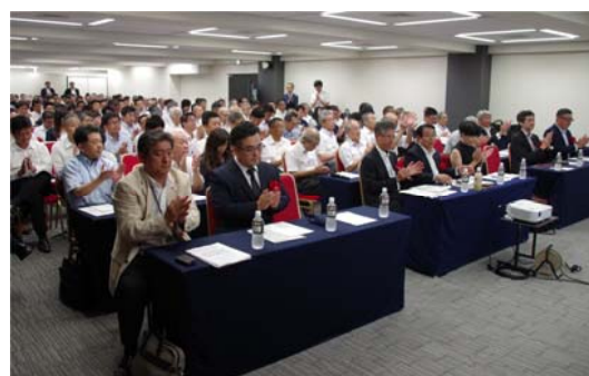
写真-2 キックオフフォーラムの会場