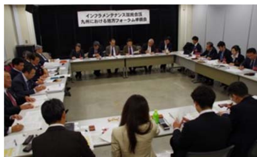
写真-1 九州フォーラム設立準備会

九州フォーラムの設立にあたり、インフラメンテナンス国民会議が掲げた上記 5 項目の目的と産官学民の連携を軸に、九州の地域性を重視したインフラメンテナンスに関する自治体支援や新技術開発ならびにその社会実装に向けた情報交換、ベストプラクティスの水平展開、取り組みのマッチングによる課題解決策の構築などについて活動を展開していくことを決定した。また、九州フォーラムの活動に熱意とボランティア精神をもった会員を募り、リーダー及び事務局を兼ねる企画委員を選出した。