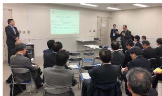
写真-6 地方フォーラム交流会