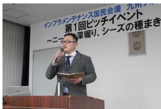
写真-5 グループ会議の状況とファシリテーターによる総括