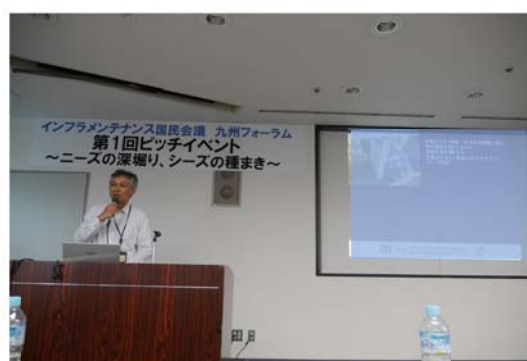
写真-4 ニーズ及びシーズの発表状況（左：ニーズ発表、右：シーズ発表）