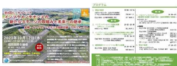
図-3 第8回ピッチイベント案内

今年度は、地方イベントの第三弾として宮崎県で開催した。県内で収集したニーズに対してマッチング活動を行うことで、地域に根ざした活動を展開した。パネルディスカッションでは、「市町村管理橋梁のメンテナンスの現状と未来へのきざし」と題して、宮崎県内市町村管理橋梁のインフラメンテナンスの課題や今後の在り方について幅広く議論いただいた。