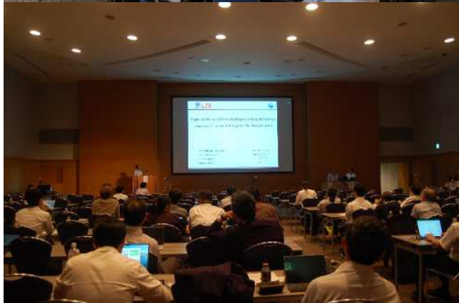
写真2 発表会場の様子