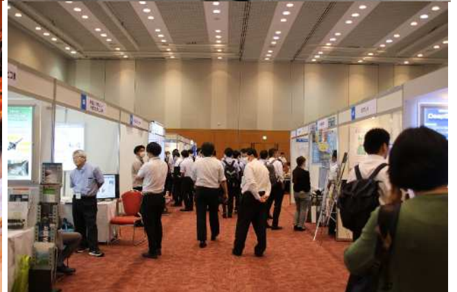
写真3 技術展示会場（1階と2階）