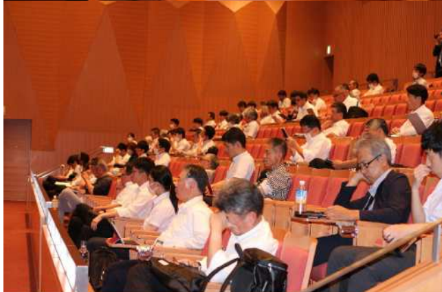
写真1 福岡国際会議場のメインホールの様子