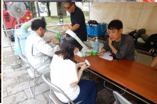
写真4 市民向けイベント（天神中央公園）